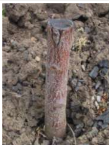
Řez na ostro

Podzim – vyorání roubovanců se zapěstovanou korunkou.