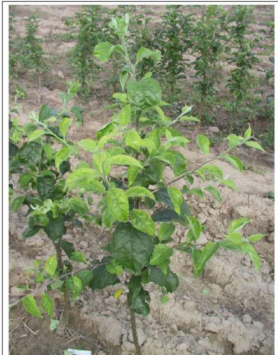
stromek knipbaumu v polovině června

Abychom podpořili předčasné větvení, provádí se během vegetace ještě několikrát úprava vzrůstného vrcholu, kdy se zaštipují (pejzují) nevrchnější části nejmladších listů na vrcholu, ale nesmí se poškodit hlavní vzrůstný vrchol. Alternativní možností je využití postřiku fytohormonů – přípravek Promalin – který vytvoří tu samou službu jako pejzování, ale moc postřik se nepoužívá, neboť je moc drahý.